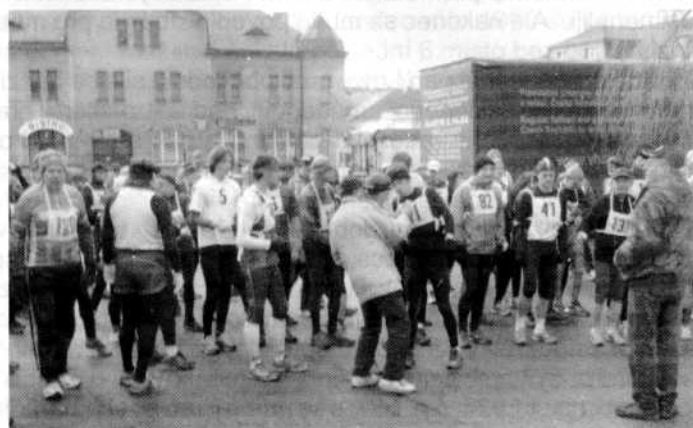
Jubilejní 40. vánoční kros Sokola Mýto proběhl v sobotu 17.12.2011 odpoledne. Výsledkovou listinu a fotodokumentaci najdete na webových stránkách města www.mestomyto.cz.