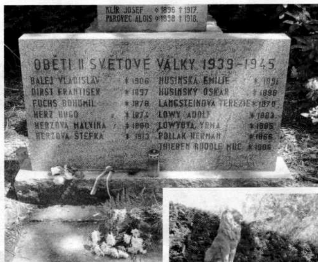
Fotografie: pomník mýtským občanům na mýtském náměstí - obětem 1. a 2. světové války, na němž najdeme i jména židovských spoluobčanů, zmiňovaných v tomto článku